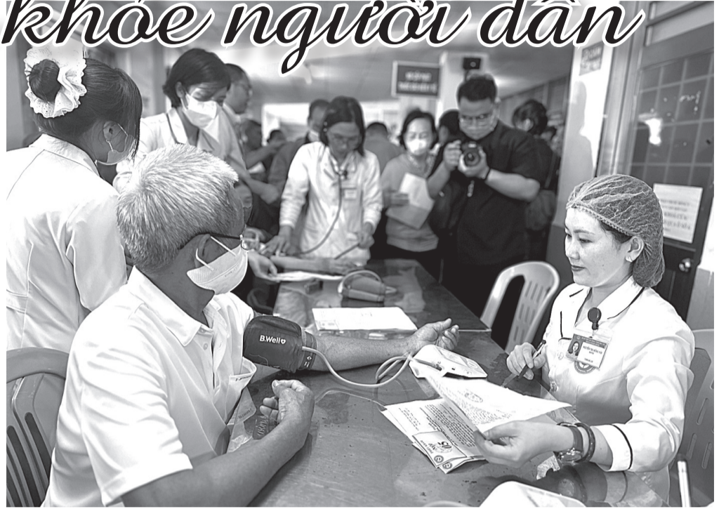
Nhân viên y tế đo huyết áp tất cả người dân đến khám tầm soát

Báo Phú Yên ghi lại một số hình ảnh các hoạt động này.