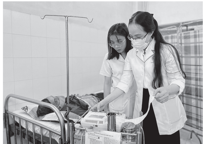
Nhân viên y tế đo điện tim, kiểm tra sức khỏe tim mạch cho người dân