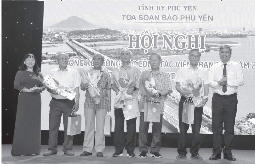
Ban Biên tập tặng hoa và quà cho các cộng tác viên đặc biệt.

Công tác chuyển đổi số báo chí được Ban Biên tập quan tâm, chỉ đạo thực hiện. Trong năm 2024, Ban Biên tập đã thành lập Tổ công tác chuyển đổi số; chỉ đạo các phòng chuyên môn đầu tư thực hiện các sản phẩm báo chí số và thường xuyên chia sẻ tin, bài nổi bật từ website https://baophuyen.vn lên fanpage Báo Phú Yên; cung cấp một số