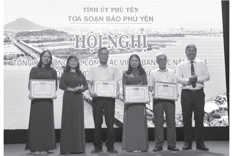
Ban Biên tập tặng giấy khen cho các cộng tác viên xuất sắc.