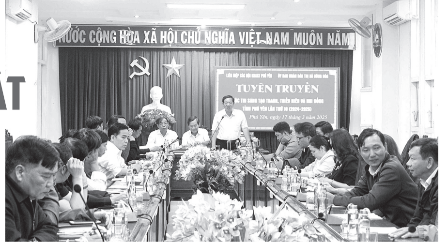
Tuyên truyền, phổ biến thông tin về cuộc thi, hội thi cho giáo viên ở TX Đông Hòa.

Liên hiệp các hội Khoa học và Kỹ thuật tỉnh vừa phối hợp với UBND TX Đông Hòa, UBND các huyện Tây Hòa, Sông Hinh tổ chức tuyên truyền, phổ biến thông tin về cuộc thi Sáng tạo thanh thiếu niên - nhi đồng Phú Yên lần thứ 10 (2024-2025) và hội thi Sáng tạo kỹ thuật tỉnh Phú Yên lần thứ 11 (2024-2025) đến đội ngũ lãnh đạo, giáo viên các trường tiểu học, THCS, THPT tại các địa phương này... Việc này góp phần lan tỏa cuộc thi, hội thi sáng tạo kỹ thuật, thu hút nhiều thí sinh và nhiều giải pháp kỹ thuật tham gia.