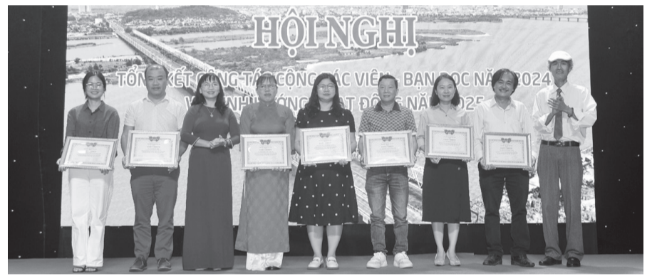
Ban Biên tập tặng giấy khen cho các cộng tác viên tích cực.

Tỉnh ủy đánh giá cao những đổi mới của Báo Phú Yên trong thời gian qua; mong muốn thời gian tới báo tập trung tuyên truyền mạnh về vấn đề sắp xếp tổ chức bộ máy, khởi nghiệp, kinh tế xanh, kinh tế tuần hoàn, công tác giải phóng mặt bằng để thực hiện các dự án; phản ánh những mô hình chuyển đổi số ở cơ sở, đổi mới cách tuyên truyền về du lịch sao cho hấp dẫn, sinh động; tăng cường các bài viết về người tốt, việc tốt... Đồng chí Đào Tấn Lộc cũng mong muốn lĩnh vực văn hóa nghệ thuật trên Báo Phú Yên cần tăng cường quảng bá tác phẩm của các tác giả là người Phú Yên và các tác giả ở địa phương khác viết về Phú Yên.