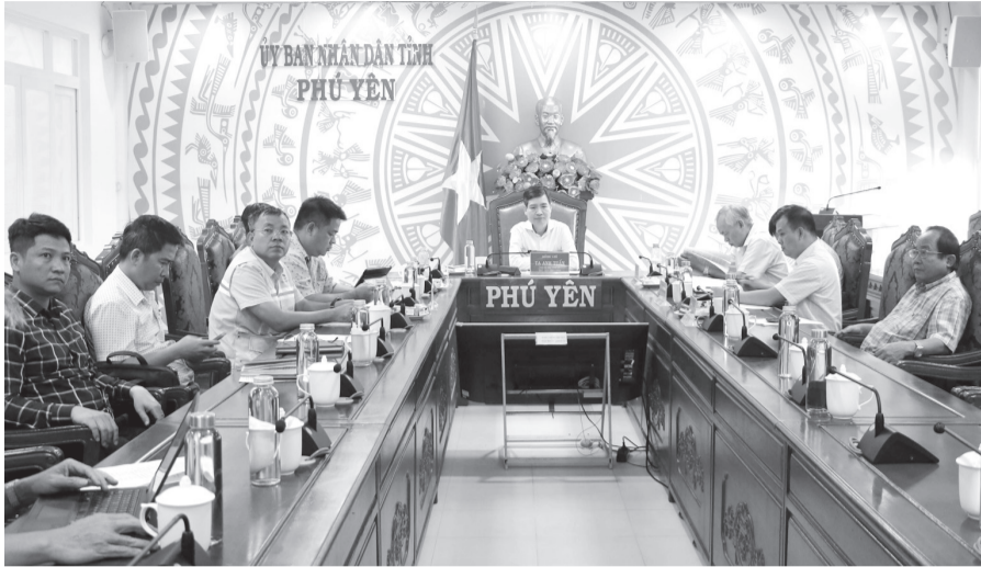
Quang cảnh hội nghị tại điểm cầu Phú Yên