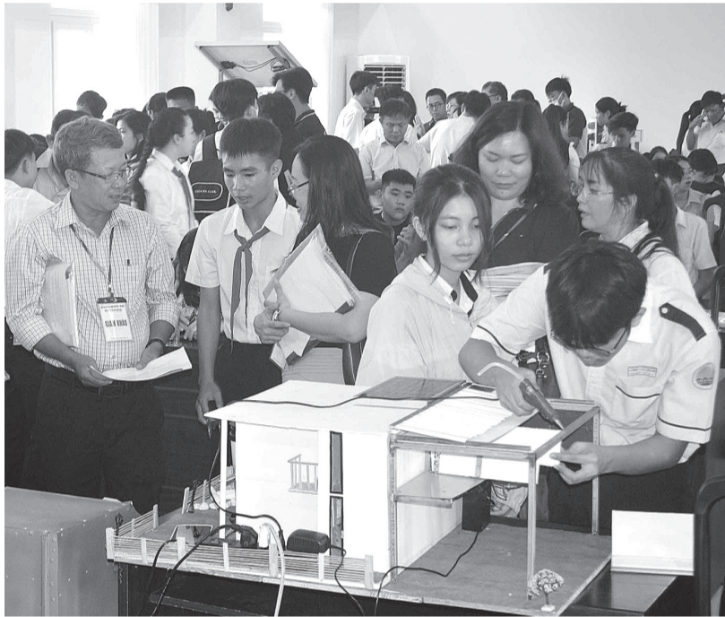
Các thí sinh tham gia cuộc thi Sáng tạo thanh thiếu niên - nhi đồng lần thứ 9.