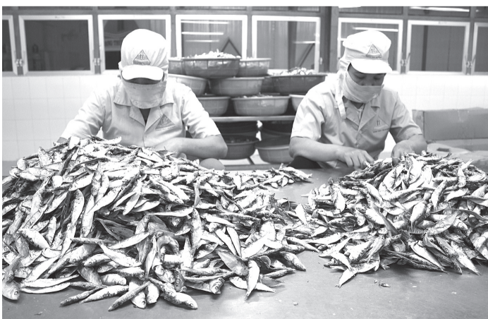
Doanh nghiệp mong muốn ngân hàng giảm lãi suất, ổn định tỉ giá để tiếp cận vốn thuận lợi. Trong ảnh: Chế biến thủy sản xuất khẩu tại một doanh nghiệp ở KCN An Phú (TP Tuy Hòa).