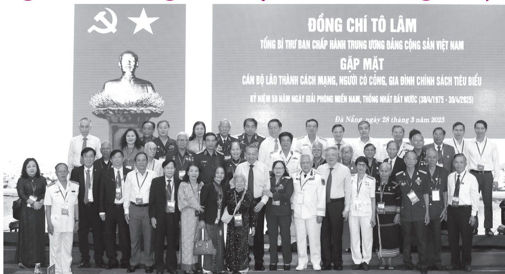
Tổng Bí thư Tô Lâm với các đại biểu.

Nhân kỷ niệm 50 năm Ngày Giải phóng miền Nam, thống nhất đất nước (30/4/1975-30/4/2025), tại TP Đà Nẵng, Tổng Bí thư Tô Lâm vừa gặp mặt cán bộ lão thành cách mạng, người có công, gia đình chính sách tiêu biểu khu vực miền Trung - Tây Nguyên.