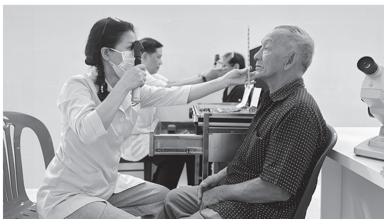
Bác sĩ khám mắt cho người dân