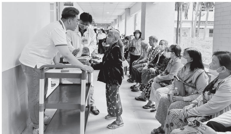
Nhân viên y tế tại khu vực khám mắt đón tiếp người dân