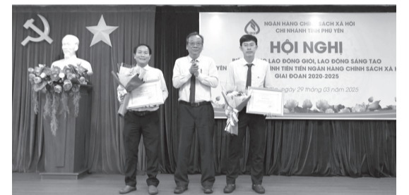
Hai tập thể xuất sắc được nhận giấy khen của Tổng giám đốc NHCSXH Việt Nam

Theo báo cáo tại hội nghị, 5 năm qua, tập thể, cán bộ nhân viên NHCSXH Phú Yên đã không ngừng phấn đấu thi đua, nỗ lực vượt qua khó khăn thử thách, chuyển tải nguồn vốn các chương trình tín dụng ưu đãi của Chính phủ đến với người nghèo và các đối tượng chính sách trên phạm vi toàn tỉnh được nhanh chóng, thuận lợi. Giai đoạn 2020-2025, chi nhánh đã giải ngân 7.512 tỉ đồng cho 206.227 lượt hộ vay vốn.