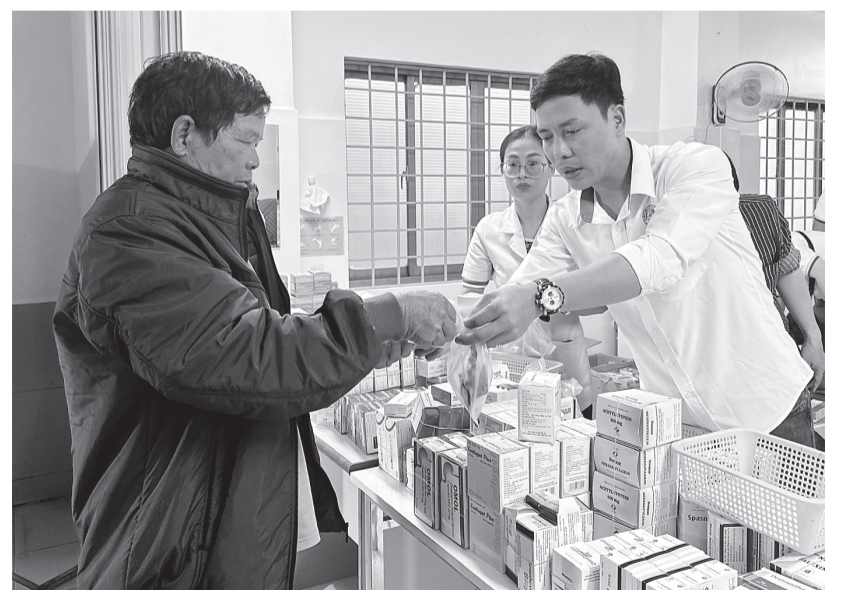
Sau khi khám sàng lọc, người dân được cấp thuốc theo đơn bác sĩ