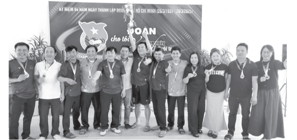
Thành đoàn trao giải nhất hội thao các thế hệ thủ lĩnh thanh niên Tuy Hòa năm 2025 cho Đội liên quân các phường: 1, 2, 4, Phú Lâm, Phú Thạnh, Phú Đông

Thành đoàn Tuy Hòa vừa tổ chức tọa đàm gặp mặt kỷ niệm 94 năm Ngày thành lập Đoàn TNCS Hồ Chí Minh (26/3/1931-26/3/2025) với sự tham dự của nguyên ủy viên Ban Thường vụ Thành đoàn qua các thời kỳ; Thường trực Thành đoàn cùng Thường trực các cơ sở đoàn trực thuộc Thành đoàn.