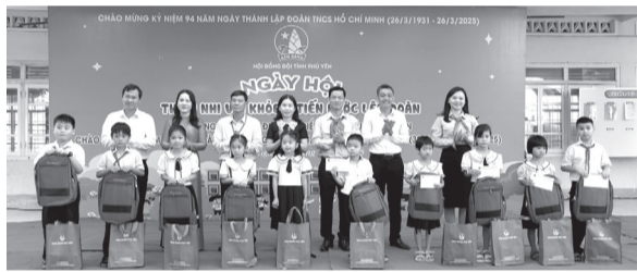
Lãnh đạo Hội đồng Đội tỉnh, huyện Tây Hòa trao quà cho học sinh có hoàn cảnh khó khăn của Trường tiểu học Hòa Bình 1.

Ngày 24/3, tại Trường tiểu học Hòa Bình 1 và Trường THCS Hòa Thịnh (huyện Tây Hòa), Tỉnh đoàn, Hội đồng Đội tỉnh tổ chức Ngày hội “Thiếu nhi vui khỏe - Tiến bước lên Đoàn” năm học 2024-2025 chào mừng kỷ niệm 50 năm Ngày Giải phóng miền Nam thống nhất đất nước (30/4/1975-30/4/2025) và 94 năm Ngày thành lập Đoàn TNCS Hồ Chí Minh (26/3/1931-26/3/2025).