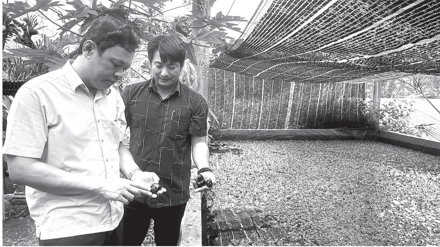
Lãnh đạo Hội Nông dân tỉnh tham quan mô hình tổ hội nghề nghiệp nuôi ốc bươu đen mang lại hiệu quả cao ở xã Xuân Long (huyện Đồng Xuân).

“Nếu như trước đây, khi làm độc lập, mỗi hộ gia đình sẽ tự sản xuất