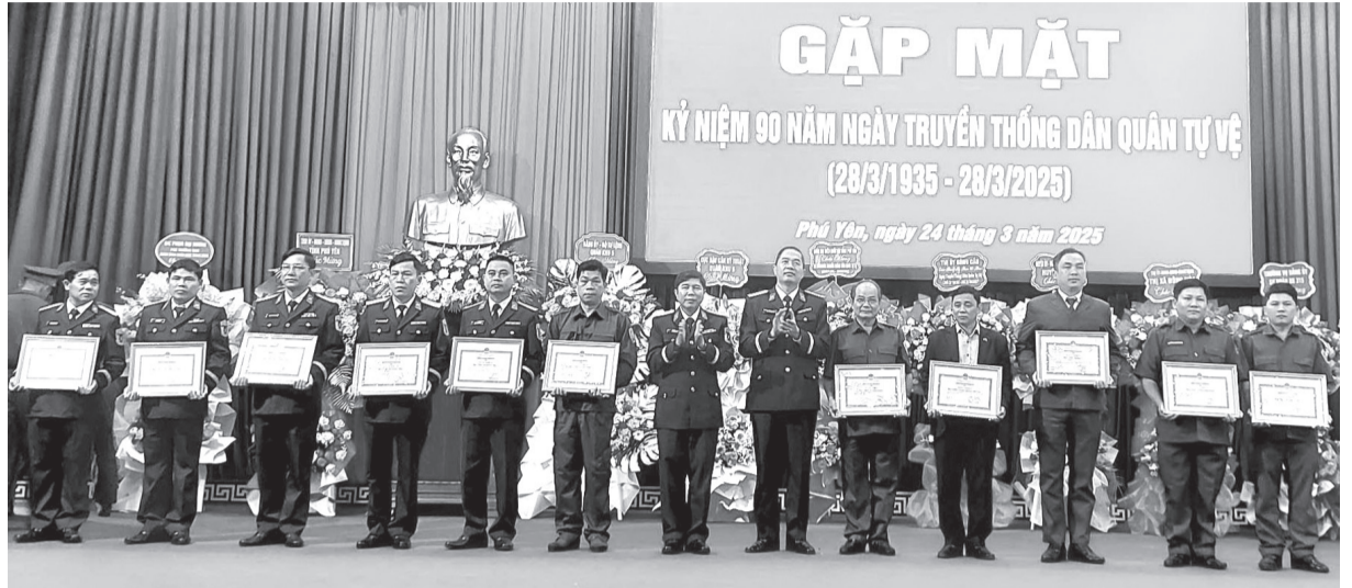
Khen thưởng các tập thể có thành tích xuất sắc trong xây dựng lực lượng DQTV

Ngày 24/3, tại TP Tuy Hòa, Bộ CHQS tỉnh tổ chức gặp mặt kỷ niệm 90 năm Ngày truyền thống Dân quân tự vệ (DQTV) Việt Nam (28/3/1935-28/3/2025).