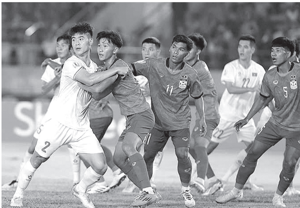
Đội tuyển Việt Nam đặt mục tiêu giành 3 điểm trước tuyển Lào

Những thông kê ấy cho thấy Lào vẫn chưa thể “ngang vai” với Việt Nam. Tuy nhiên, HLV Kim Sang Sik chắc chắn muốn các học trò thi đấu