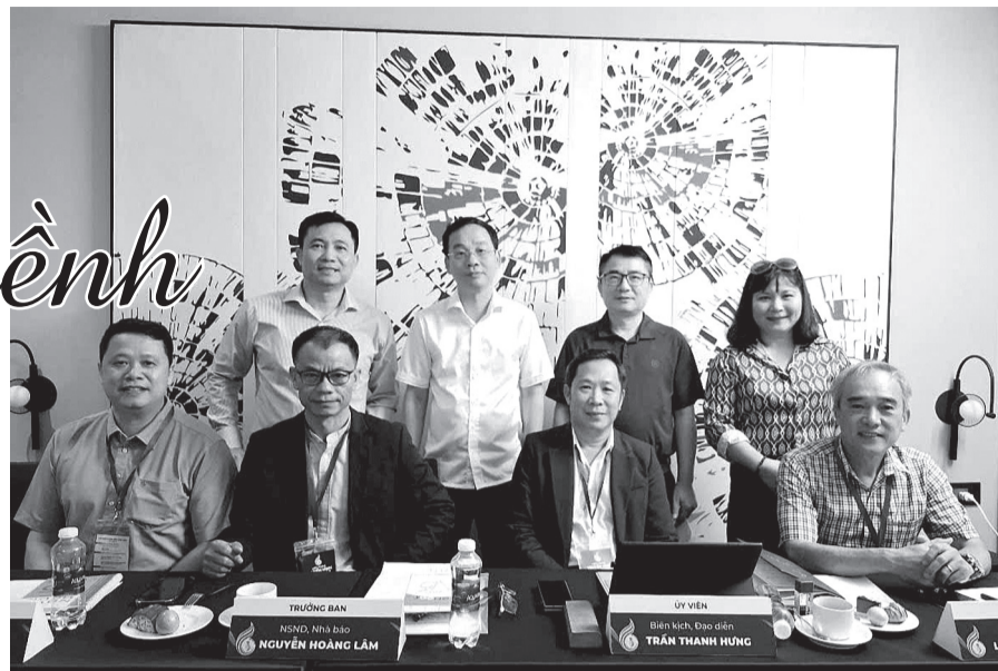
Ban giám khảo phim tài liệu chụp ảnh lưu niệm cùng một số thành viên ban tổ chức Liên hoan Truyền hình toàn quốc lần thứ 42.