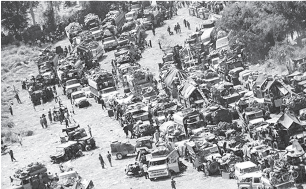
Thảm cảnh quân Ngụy tháo chạy trên đường 7.

Sau khi nghe Phạm Văn Phú báo cáo, tổng thống Nguyễn Văn Thiệu lắc đầu: Không có gì hết. Không có người, không có thiết bị để cung cấp cho anh; quân đội đang bị phân tán