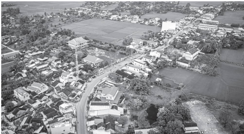
Hòa Thịnh khoác lên diện mạo của xã nông thôn mới nâng cao.

chọn làm địa điểm phát động Nhân dân đồng khởi, mở đầu cho phong trào giải phóng nông thôn, đồng bằng toàn tỉnh.