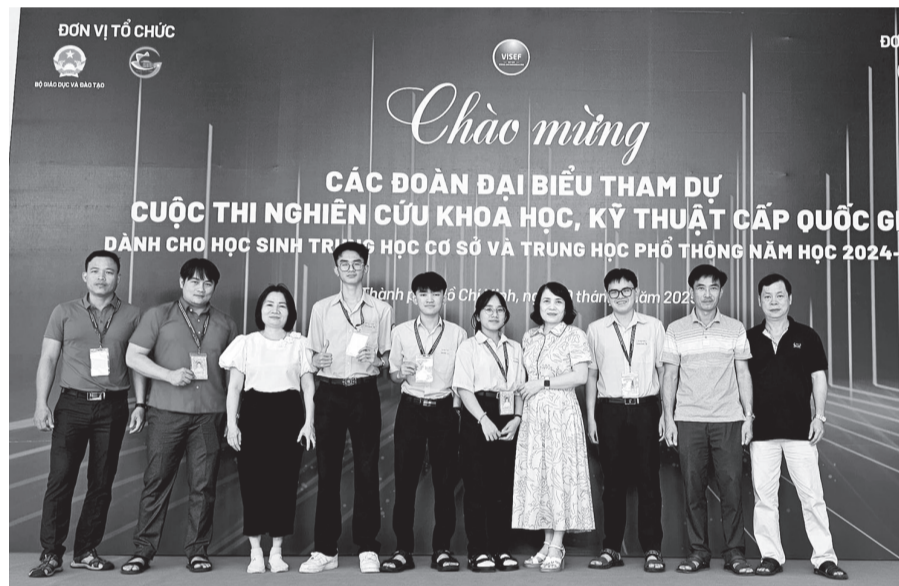
Các học sinh và thầy cô của đoàn Phú Yên chụp ảnh lưu niệm sau khi nhận giải cuộc thi Khoa học kỹ thuật cấp quốc gia học sinh THCS và THPT năm học 2024-2025.

Bộ GD&ĐT vừa tổng kết, trao giải cuộc thi Khoa học kỹ thuật cấp quốc gia học sinh THCS và THPT năm học 2024-2025.