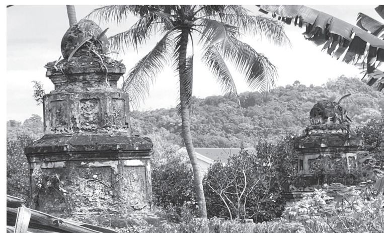
Nam Hải chi mộ tại Sông Cầu, Phú Yên.