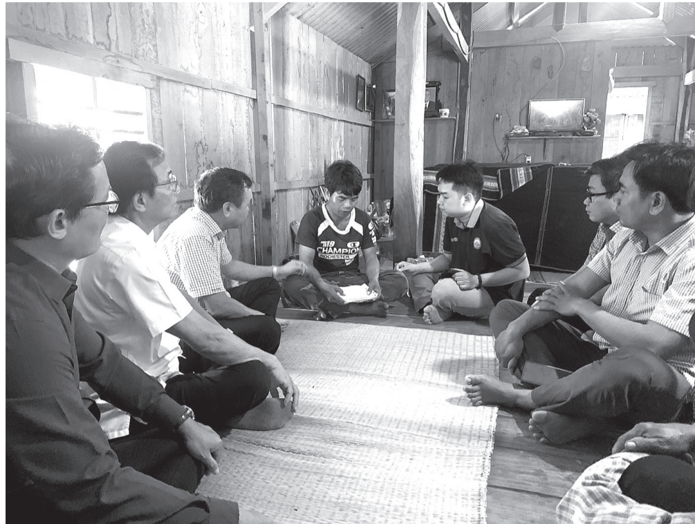
Phó Chủ tịch UBND tỉnh Đào Mỹ cùng lãnh đạo huyện Sơn Hòa và các nhà hảo tâm thăm hỏi, chia sẻ với gia đình có trẻ em tử vong do đuối nước.

Vẫn chưa đến mùa hè nắng nóng nhưng nhiều trẻ em đã đi tắm sông, tắm suối dẫn đến đuối nước. Vụ đuối nước thương tâm trên dòng sông Ba làm 4 em học sinh ở xã Krông Pa, huyện Sơn Hòa tử vong mới đây là điều cảnh báo về công tác quản lý trẻ em, phòng chống tai nạn đuối nước cần phải được thực hiện quyết liệt hơn nữa.