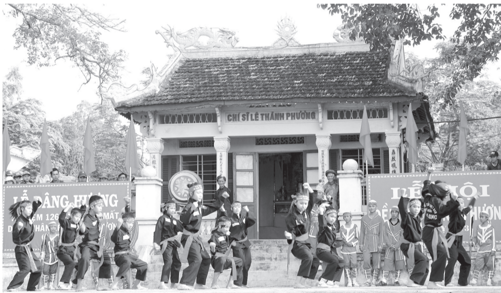
Biểu diễn võ thuật tại lễ hội Đền Lê Thành Phương - thủ lĩnh phong trào Cần Vương.

hợp triển lãm hoa, nghệ thuật đường phố, hội thảo và các tour du lịch sinh thái, nâng cao thương hiệu "thành phố ngàn hoa".