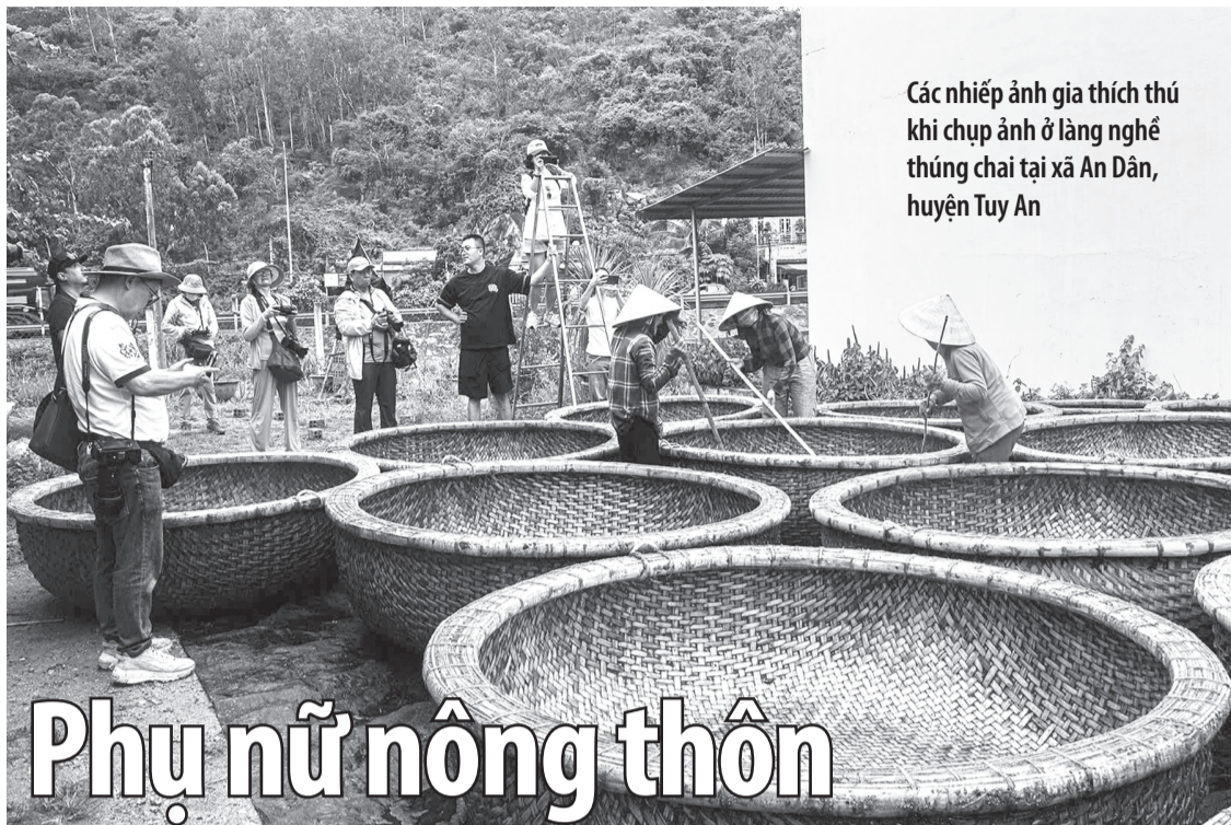
Các nhiếp ảnh gia thích thú khi chụp ảnh ở làng nghề thúng chai tại xã An Dân, huyện Tuy An