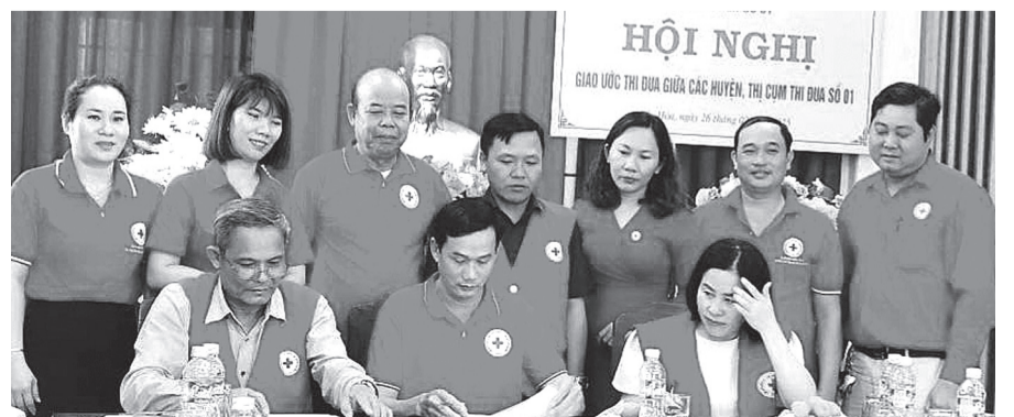
Đại diện lãnh đạo Hội Chữ thập đỏ Cụm thi đua số 1 ký kết giao ước thi đua năm 2025.