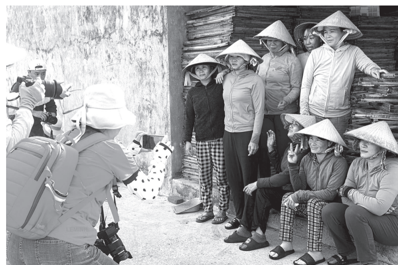
Chụp ảnh lưu niệm cho các chị em lao động ở làng nghề