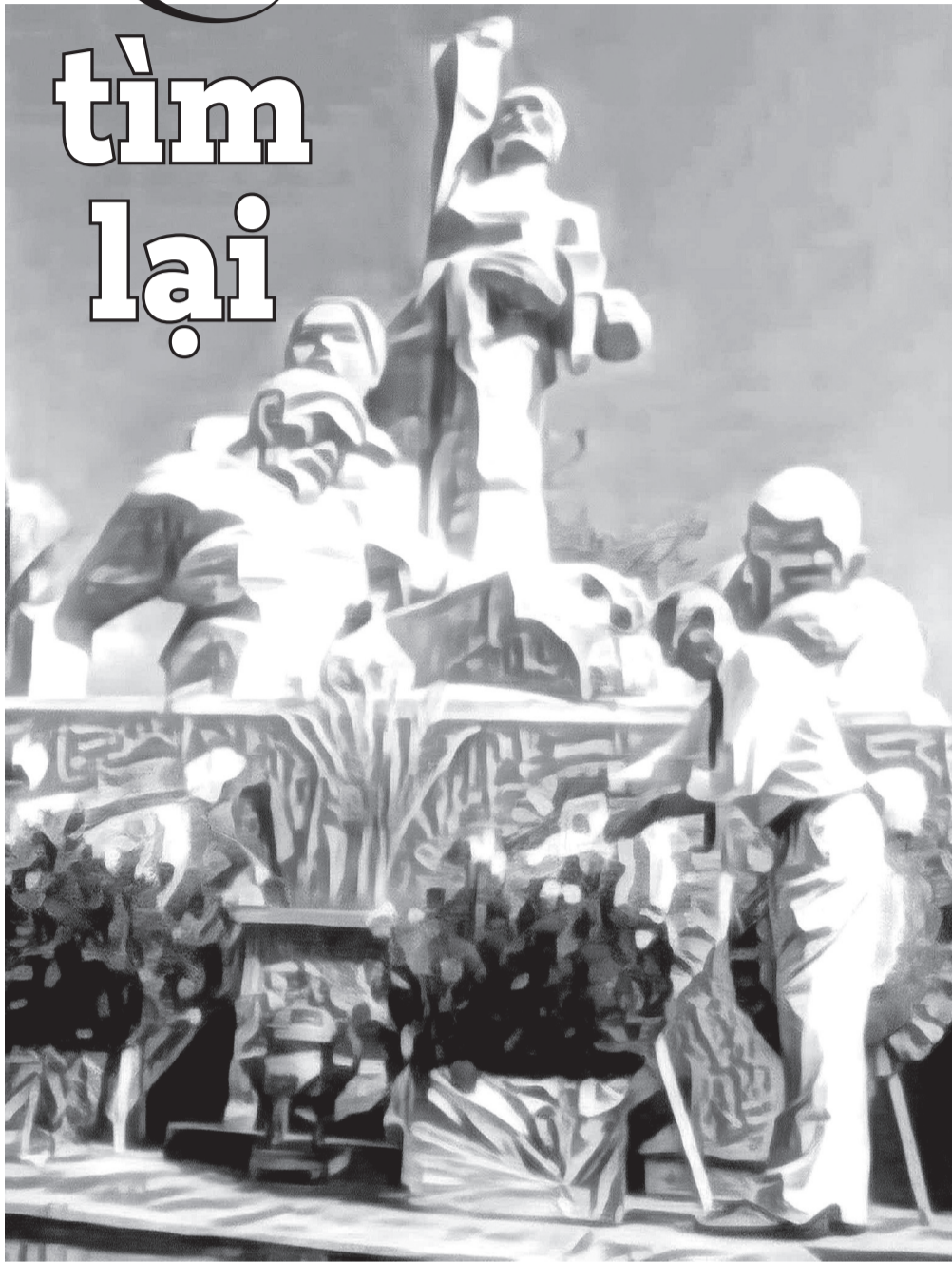
Minh họa: PV

Chuyến xe buýt trung chuyển hành khách từ sân bay về đến thành phố đã hơn bảy giờ tối. Trong số hơn mười người xuống ở trạm cuối có một người đàn ông ngoại quốc, dáng cao to, tóc và da đều trắng, trông còn khỏe mạnh.