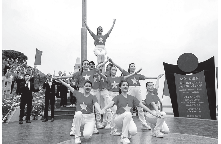
Có một Phú Yên như thế - một Phú Yên của những con người giản dị mà kiên trung.

Nếu ai đó hỏi điều gì làm nên nét đẹp riêng của Phú Yên, thì có lẽ đó chính là con người nơi đây - những con người chân chất, hiền hòa nhưng đầy nghị lực. Phú Yên không chỉ có