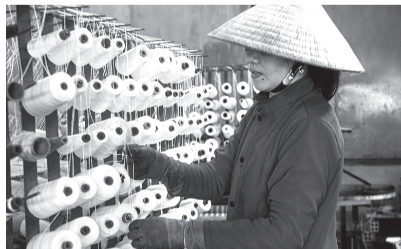
Luôn chỉ để dệt chiếu