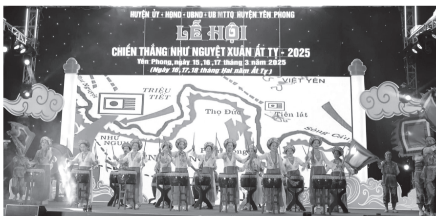
Lễ hội Chiến thắng Như Nguyệt.

Năm nay, lễ hội được tổ chức với nhiều nghi lễ trang trọng cùng các hoạt động phong phú, như: lễ rước sắc; dâng hương; trống hội; hát dân ca quan họ