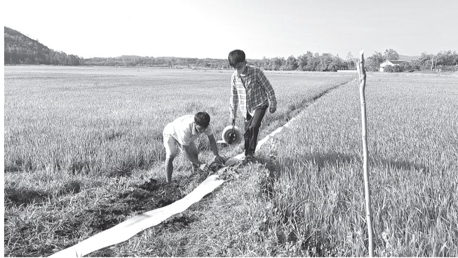
Ruộng khô nước, nông dân xã An Hòa Hải (huyện Tuy An) nối đường ống dài gần 100m bơm nước từ mương lên phóng phèn.

mương chứa nước ngọt bơm vào ruộng để phóng phèn giúp lúa sinh trưởng, phát triển tốt”, ông Tiên nói.