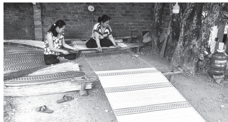
Chiếu được dệt thủ công