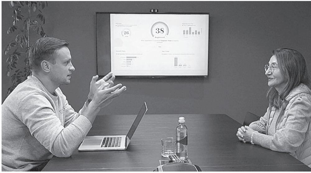
Dữ liệu ẩn danh cung cấp cho các nhà quản lý giải pháp tối ưu về nhân sự.

Mindletic ra đời từ nhu cầu ấy, với mục tiêu hỗ trợ người lao động quản lý cảm xúc, căng thẳng và hạn chế chi phí phát sinh từ sức khỏe tinh thần suy giảm. Nền tảng này cung cấp các công cụ để theo dõi năng lượng, đánh giá trạng thái cảm xúc và thực hành những bước đơn giản nhưng hiệu quả nhằm giúp cân bằng tâm trạng. Điểm nổi bật của Mindletic là khả năng cung cấp dữ liệu ẩn danh cho doanh nghiệp, giúp