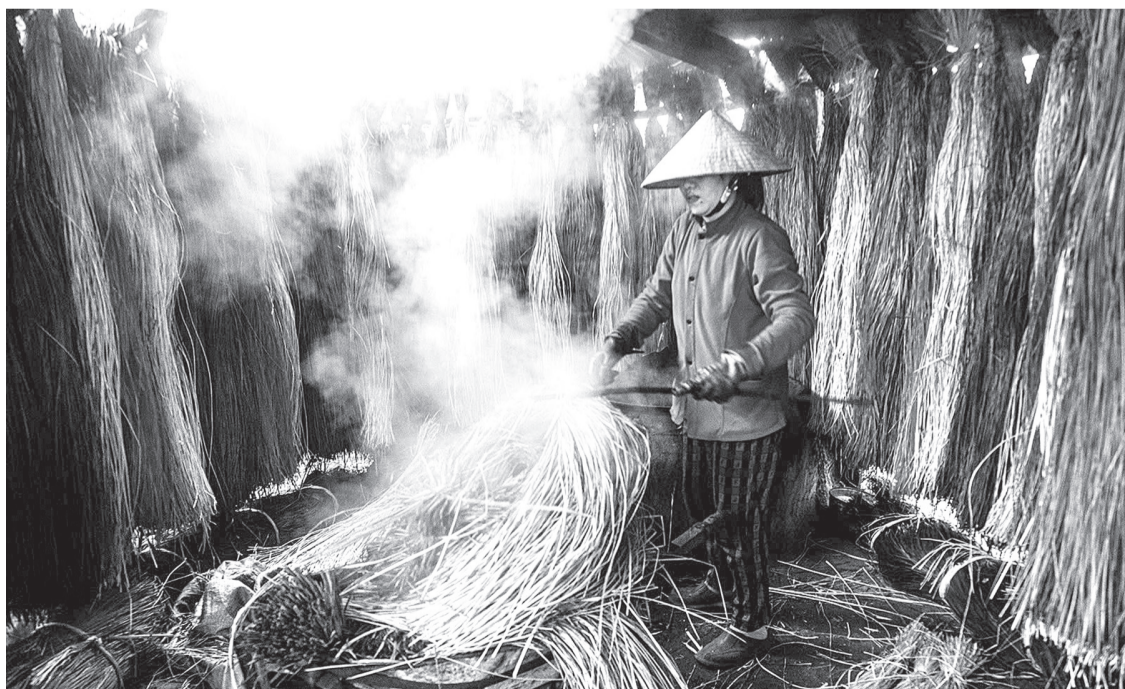
Nhuộm cói làm chiếu ở thôn Phú Tân, xã An Cư, huyện Tuy An