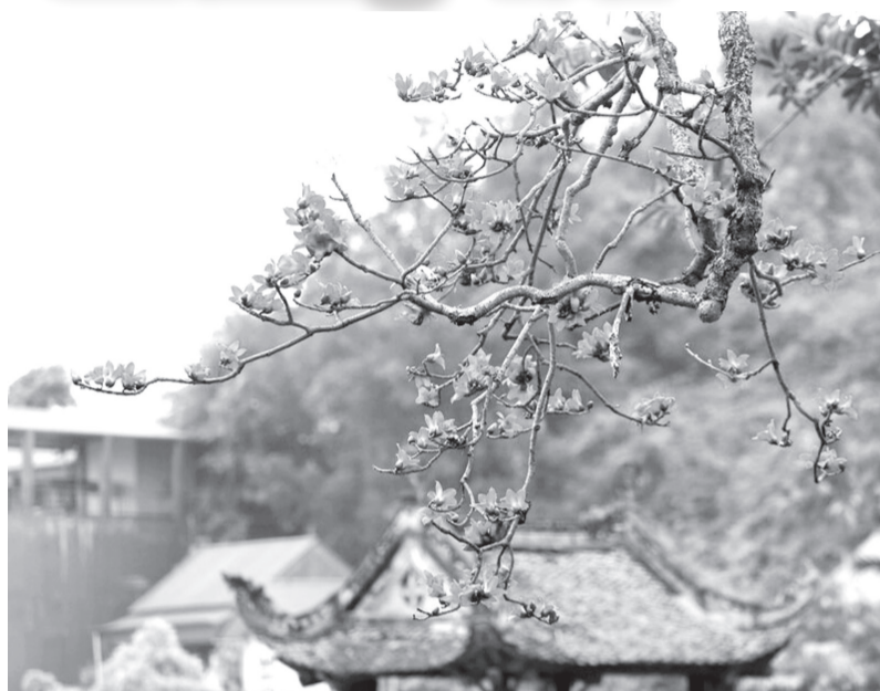
Hoa gạo tháng ba.