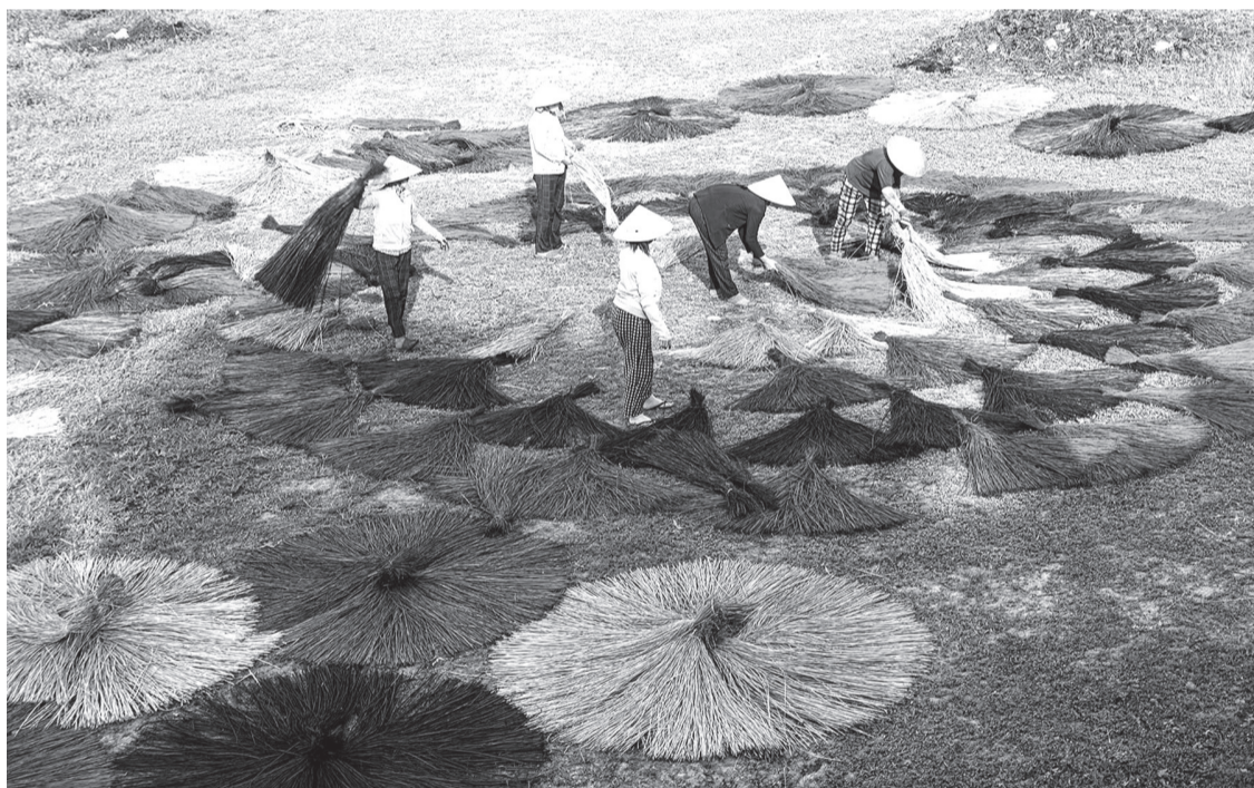
Phơi cói sau khi nhuộm

Thời gian qua, các đoàn nhiếp ảnh trong và ngoài nước lặn lội tìm đến nhiều làng nghề truyền thống ở Phú Yên như làng nghề chiếu cói thôn Phú Tân 1, xã An Cư; làng nghề thúng chai thôn Phú Mỹ, xã An Dân; đánh bắt cá com xã An Hòa Hải, huyện Tuy An... để chụp ảnh. Vẻ đẹp thiên nhiên cùng những khoảnh khắc đời thường của người dân lao động, nhất là phụ nữ làng nghề tạo cảm hứng sáng tác cho nhiều người.