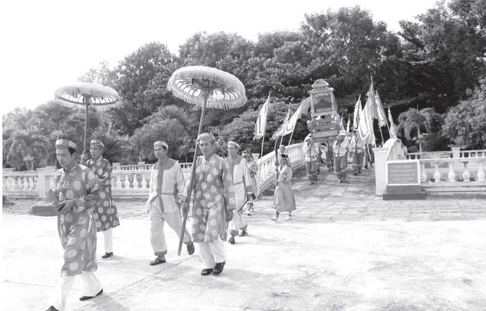
Lễ hội Đền Lương Văn Chánh - vị thành hoàng mở đất, để Phú Yên chính thức có tên trên bản đồ Việt Nam năm 1611.