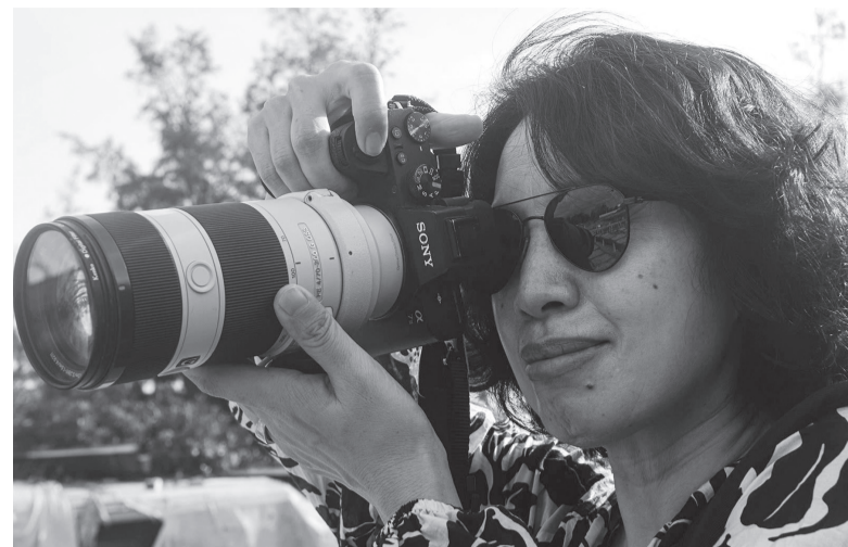
Nhiếp ảnh gia người Trung Quốc chụp ảnh ở làng nghề chiếu cói