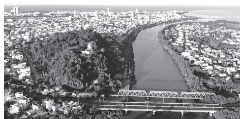
TP Tuy Hòa nhìn từ trên cao.