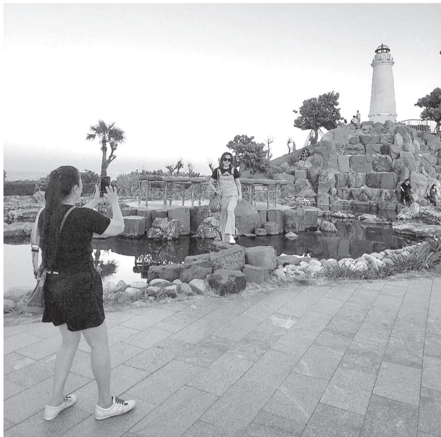
Du khách tham quan, chụp ảnh lưu niệm tại khu vực công viên biển Tuy Hòa.

UBND tỉnh giao Sở VH&DL phối hợp với Hiệp hội Du lịch Phú Yên, các cơ quan, đơn vị, địa phương,