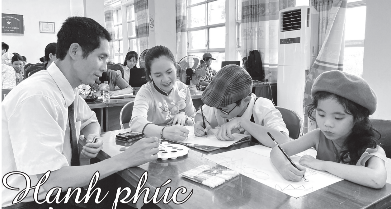
Gia đình hòa thuận, hạnh phúc thì xã hội phồn vinh và phát triển bền vững. Trong ảnh: Một gia đình tham gia hội thi Gia đình đọc sách tỉnh Phú Yên.

Luôn ý thức được rằng, nền tảng của một gia đình hạnh phúc bền vững bắt đầu từ kinh tế ổn định, vợ chồng