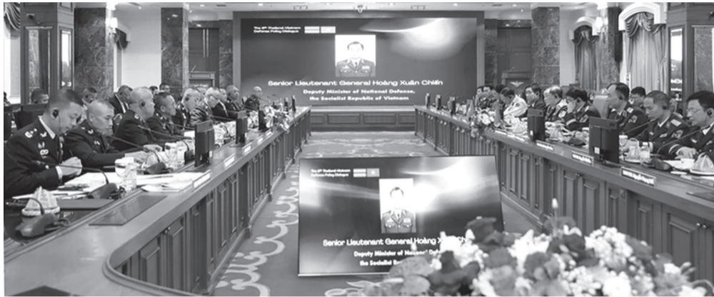
Phiên Đối thoại Chính sách quốc phòng Việt Nam - Thái Lan lần thứ sáu tại trụ sở Bộ Quốc phòng Thái Lan.

Thượng tướng Hoàng Xuân Chiến khẳng định Việt Nam nhất quán đường lối đối ngoại độc lập, tự chủ, hòa bình, hữu nghị, hợp tác và phát triển, đa phương hóa, đa dạng hóa quan hệ đối ngoại; kiên trì Chính sách quốc phòng "4 không"; kiên trì đấu