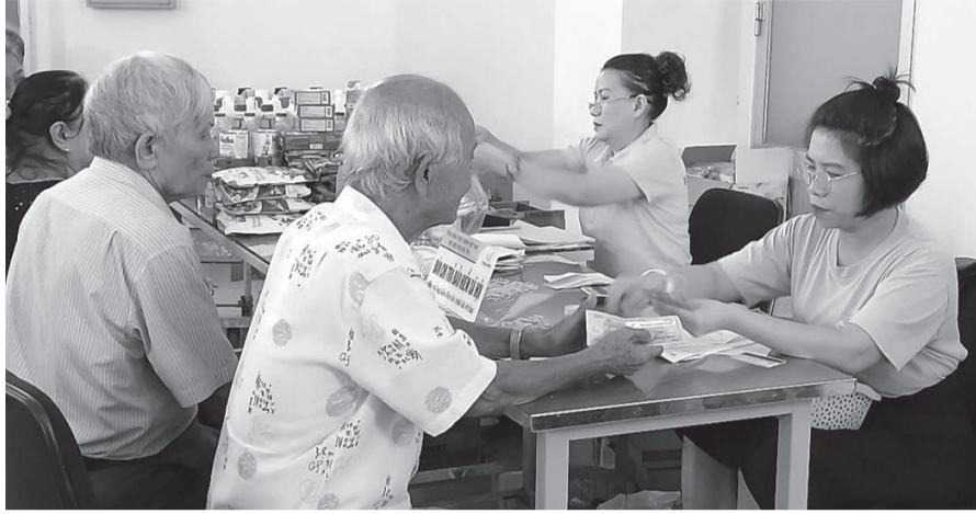
Người cao tuổi nhận lương hưu tại Buu điện TP Tuy Hòa.

Phú Yên hiện có hơn 16.400 người tham gia BHXH được chi trả lương hưu hằng tháng khi hết tuổi lao động. Mức lương hưu bình quân từ khoảng 3-6 triệu đồng đã giúp cho người cao tuổi, đặc biệt là người ở khu vực nông thôn đủ lo bản thân, không phụ thuộc vào con cháu, đồng thời cũng an tâm hơn khi đi khám chữa bệnh bởi đã có thẻ BHYT.