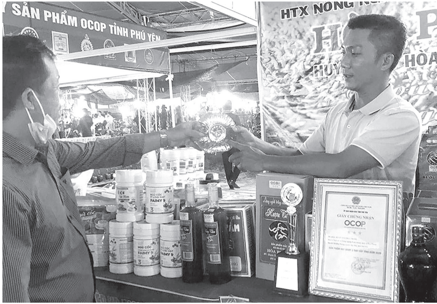
HTX Hòa Phong đang nỗ lực tìm cách củng cố thương hiệu sản phẩm rượu tầm Hòa Phong nhằm đẩy mạnh tiêu thụ, duy trì sự phát triển của làng nghề truyền thống.

HTX cũng mở dịch vụ cho thuê mặt bằng kinh doanh, gồm 12.692m 2 đất mặt bằng và 4 ki-ốt tại chợ với diện tích 162m 2 . HTX còn duy trì dịch