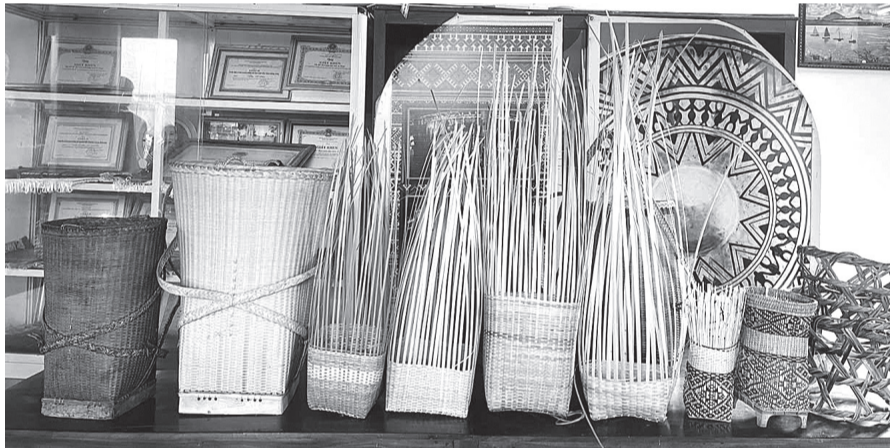
Những sản phẩm thủ công được tạo ra từ những đôi bàn tay khéo léo của người thợ.

là kinh nghiệm quý báu của người làm nghề, thể hiện sự trân trọng với thiên nhiên và lòng tận tâm với sản phẩm của mình.