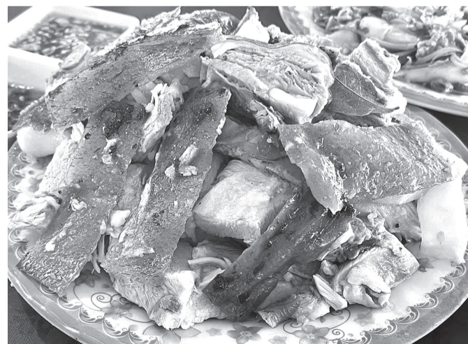
Heo quay Lạng Sơn là món ăn đặc trưng của người dân tộc Tày, Nùng ở xã Ea Ly, huyện Sông Hinh.

Heo quay Lạng Sơn thường được ăn với các loại