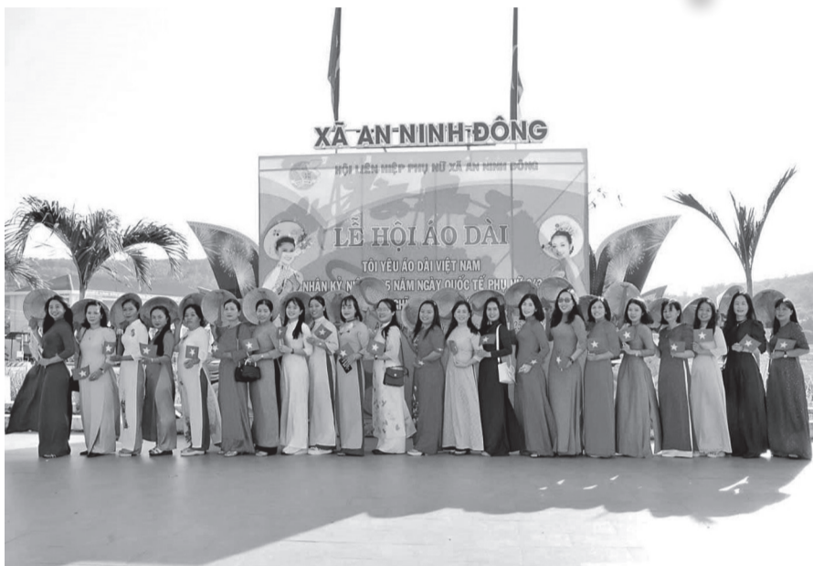
Phụ nữ xã An Ninh Đông (huyện Tuy An) với hoạt động tôn vinh áo dài Việt Nam.