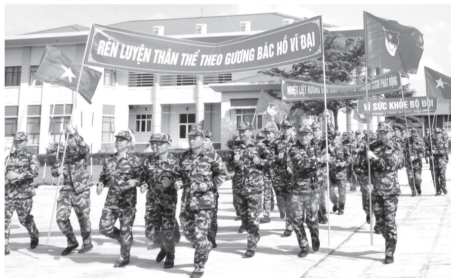
Cán bộ, chiến sĩ Lữ đoàn 682 hưởng ứng Ngày chạy thể thao quân sự, kết hợp Ngày chạy Olympic vì sức khỏe toàn dân năm 2025.