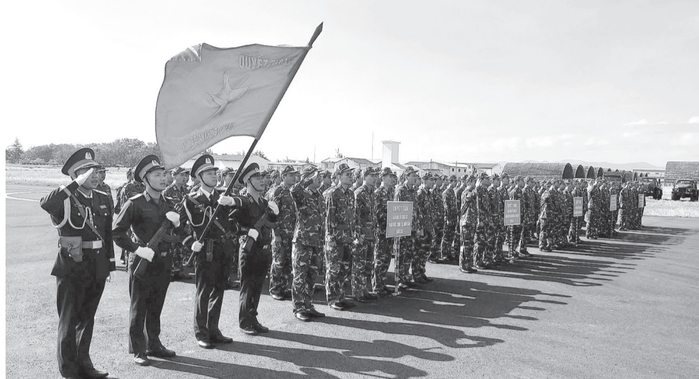
Trung đoàn Không quân 915 chào cờ trong lễ ra quân huấn luyện năm 2025.

Đồng thời huấn luyện các đơn, hải đội biên phòng nắm chắc và vận dụng tốt chủ trương, đối sách trong công tác quản lý, bảo vệ chủ quyền, an ninh biên giới, vùng biển đảo; các hiệp định, hiệp nghị, thỏa thuận song phương, quy chế quản lý biên giới; âm mưu, phương thức, thủ đoạn hoạt động của địch và các loại đối tượng ở khu vực biên giới; nội dung các biện pháp công tác biên phòng; chủ trương của Đảng, Nhà nước ta về hoạt động đối ngoại biên phòng; kỹ, chiến thuật, tổ đội BDBP chiến đấu tập kích, phục kích, truy lùng, chiến thuật chiến đấu bảo vệ đồn, trạm. Huấn luyện chuyên sâu hệ thống văn bản pháp luật về biên giới, cửa khẩu; phòng chống IUU; công tác điều tra cơ bản trong phòng, chống tội phạm mua bán người, buôn lậu và gian lận thương mại; công tác