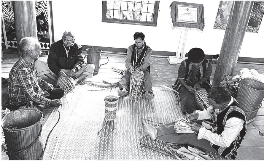
Các nghệ nhân thi đan lát thủ công trong khuôn khổ lễ hội Trống đôi, công ba, chiêng năm xuân Ất Ty 2025.