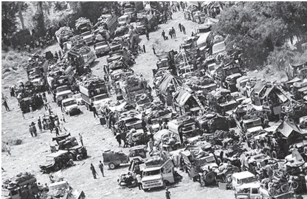
Thảm kịch của nguy quân Sài Gòn trên đường số 7 khi bị quân ta bao vây chặn đánh (tháng 3/1975).

Ngày 10/2/1975, việc triển khai đội hình của sư đoàn cơ bản hoàn thành, các đơn vị được lệnh khẩn trương làm