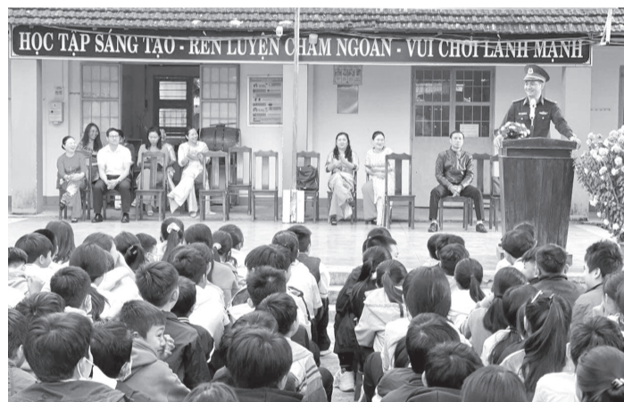
Đồn Biên phòng Xuân Đài tổ chức Tiết học biên giới, biển đảo tại Trường THCS Hoàng Văn Thụ (TX Sông Cầu).